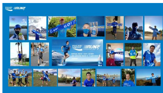
バーチャルラン「ポカリスエットラン」に参加した当社社員

スポーツ庁では、従業員の健康増進のためにスポーツ活動の支援や促進に向けた積極的な取り組みを実施している企業を「スポーツエールカンパニー」として認定しています。これまでも当社は職場や自宅での運動機会の提供を行ってきましたが、2020年度以降はオフィス内リフレッシュ体操をリモートワーク中にも実施できるようにオンラインで公開、スマートフォン向けのアプリを用いたウォークラリーの開催など、様々な運動機会の提供を続けています。2021年度には、海外グループ会社のバーチャルラン企画「ポカリスエットラン」に当社社員も参加し、グループ間で連携し社員や社員の家族の運動継続と健康維持・増進をサポートしました。これら取り組みが評価され、「スポーツエールカンパニー2022」に認定されました。