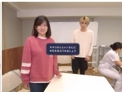
<嬉しい気持ちを伝える>