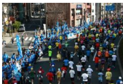
【大塚グループ社員・家族による応援：2017大会より】

Otsuka-people creating new products for better health worldwide