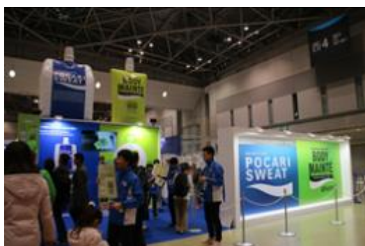
【昨年の展示ブースの様子】

大塚製薬は、オフィシャルパートナーとしてランナーをサポートする製品や情報提供を行う展示ブースを設置します。アンケートに答えていただいた先着5,000名にコンディショニング栄養食「ボディメンテ ゼリー」の提供など、ランナーにとって魅力的な内容を予定しています。