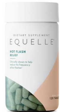
米国D to Cチャンネルで展開するエクエル

このたび、多くの女性から更年期の症状を軽減する製品としての支持を受け、より手軽に購入できるインターネット通販サイト「 equelle.com 」を開設。D to Cチャンネルでの展開により、製品の直接販売だけでなく、年齢に伴う心身の変化やエクオールに関する情報の提供および、更年期を快適に過ごすための双方向のコミュニケーションが可能となります。エクオールを摂るという選択肢を提案するとともに、本サイトを通じて「自身の健康を理解して対処する」ことをサポートし、女性の健康維持・増進へのさらなる貢献を目指します。