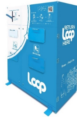
店頭 Loop 専用返却ボックス

大塚グループは、今後も脱炭素社会の実現、ひいてはサステナブルな社会の実現を目指し活動してまいります。