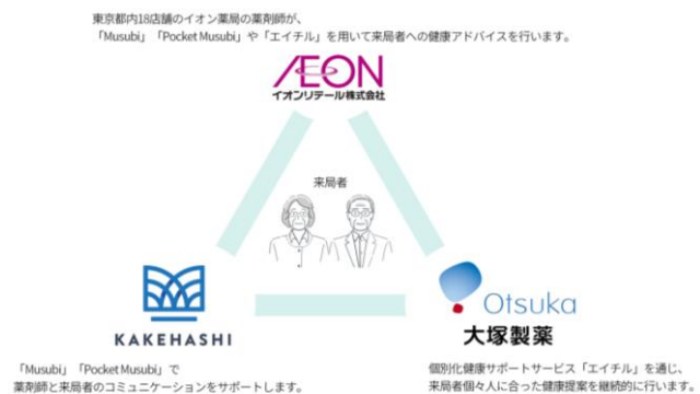
コンソーシアムによる取り組みのイメージ

東京都内18店舗の「イオン薬局」の薬剤師が「Musubi」や「エイテル」を用いて来局者への健康アドバイスを行います。